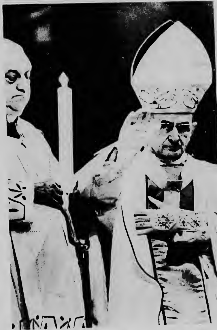
CIUDAD DEL VATICANO--Monseñor Salvatore Capoferri ta sostene man di Papa Paulo VI na haltu aki durante ordenacion di 62 sacerdo- te nobo, den cual Papa mester a keda cu su man na haltu durante largu ratu.

Ordenacion di e sacerdotenan pa Papa ta unico den historia moderno di Vaticano. Den fuente- nan di e Santa Sede a ser bisá cu no tin antecedentenan di nin- gun Papa cu a ordena sacerdo- tenan personalmente, excepto ora e Pontifice Benedicto XV a ordena un sobrino di un carden- al como un deferencia excep- cional na esaki, casi 50 aña pasa.